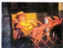
Une de nos membres en costume de la beauté.