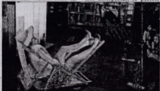
Séance de bronzage...

à la beauté qui est entreprise et magnifiquement interprétée par l'artiste. Rapidement elle se rend compte que tous ses efforts ne mènent pas au bonheur, que le paraître n'est qu'une illusion... Le public a unanimement apprécié ce spectacle plus burlesque que jamais, les applaudissements et les rires l'ont prouvé !