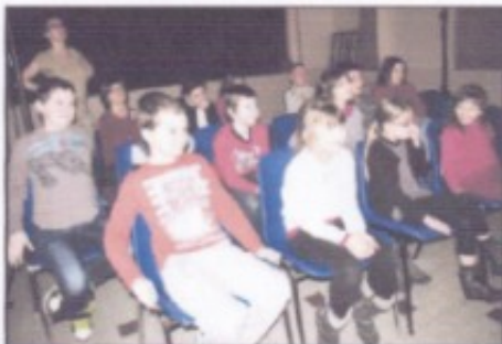
■ Les élèves en attente d'assister au spectacle.

En attendant, tous ont hâte d'assister au spectacle intégral qui sera présenté en avant-première le samedi 22 mars à 20 h 30 à la MJC de la localité.