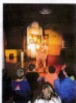
Une autre transformation ...

Cécile : Pour montrer qu'il n'y a pas besoin de parler pour faire ricaner un message. Les gens sont parlants aussi. Ce spectacle a déjà été joué à l'étranger! Le geste est compris de tous!